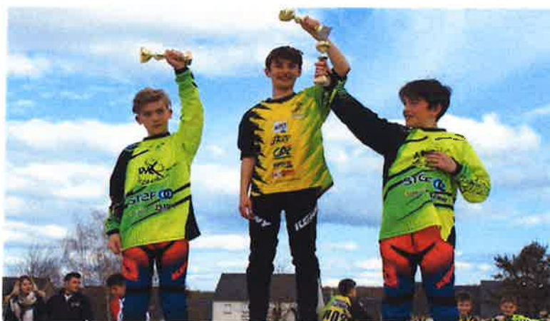
Régional BMX pour 160 pilotes

Deuxième du classement régional des clubs pour la saison écoulée, L'AS Chanceaux BMX est premier au nombre d'engagés sur les différentes compétitions et sur le nombre de podiums individuels !